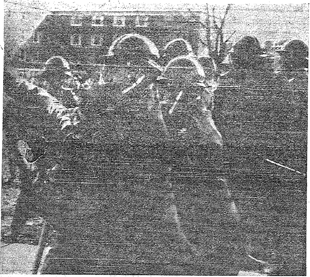
الحرس الوطني الامريكى يداوم حراجه كونهت وقد اغتزل ١٢ طالبينا كان المسؤولون يقومون بعملية التفتيش

موسكو - رويتر - ذكرت صحيفة «برافدا» الناطقة بلسان الحزب الشيوعي السوفياتي ان الاسطول السوفياتي دخل البحر الابيض المتوسط بسبب الاستفزاز الامري وسيبقى هناك دفاعا عن مصالح الدول العربية.